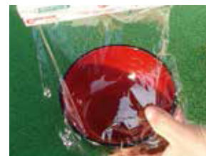
お椀にラップを敷く

※金魚の人工授精に使われています。 ※金魚用に作られていますので重宝します。 成分 NaCl 0.75% 他 KCl・CaCl・CaCo 3 含有