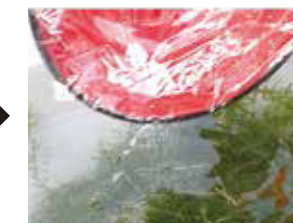
敷き巣に拡散させる